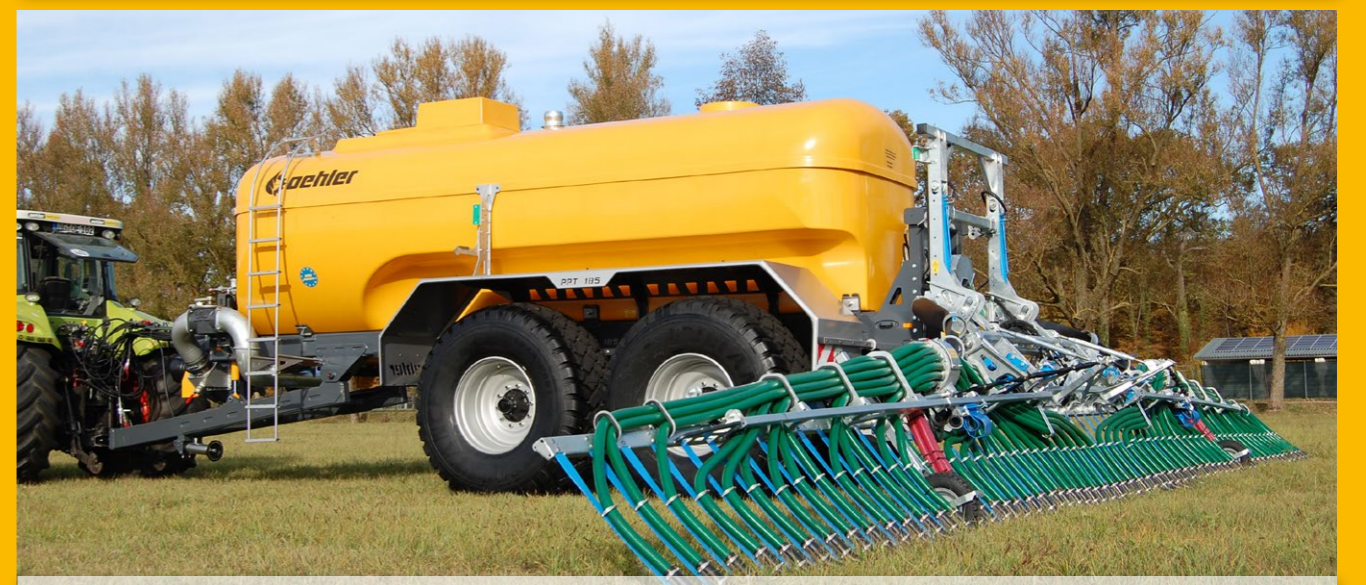
PPT 185 GFK 18.500 Liter Tandem-Pumptankwagen mit 15 mtr. Schleppschuh