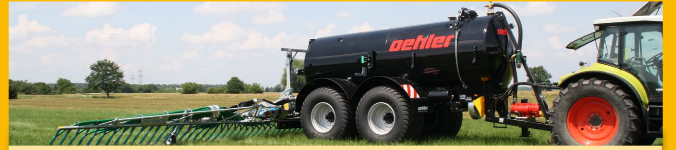
VKT 140 14.000 Liter Tandem-Vakuumtankwagen mit 15 mtr. Schleppschuhverteilung