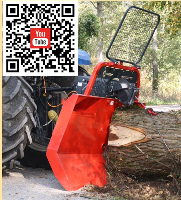
OL SW 6800P K - 2100 Getriebe-Seilwinde mit Konstantzug für Forst Profis

terra funk Profi Terra Funk Mit Neigungssensor