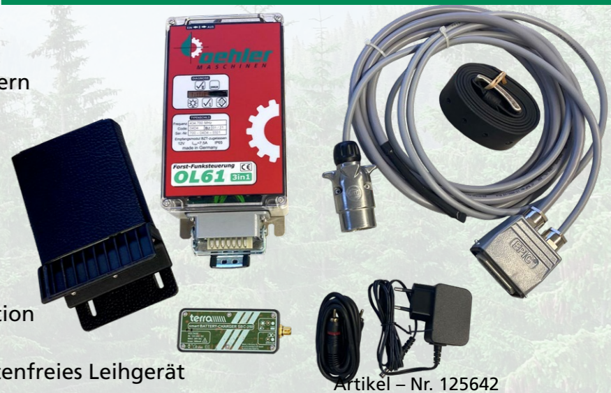
Artikel - Nr. 125642

0% Zugkraftverlust bei Konstantzugseilwinden